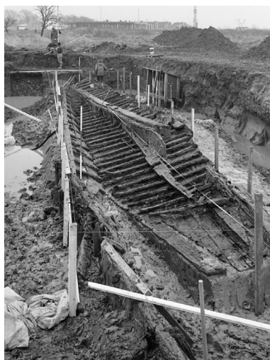
Gevonden Romeins schip in Zwammerdam, in 1972.

Alphen dankt waarschijnlijk haar ontstaan en naam aan het Romeinse castellum Albaniana, dat “nederzetting aan het witte water” betekent. Archeologische vondsten hebben aangetoond dat al tijdens de regering van keizer Claudius (41-54 na Chr.) afdelingen van het Romeinse leger in Alphen waren gestationeerd. Het castellum lag ongeveer tussen de St. Jorisstraat en de Castellumstraat. De eerste huizen stonden hier al zo’n 2000 jaar geleden. Alphen lag toen aan de noordgrens van het Romeinse rijk. Het was een onderdeel van de versterking langs de Rijn, een van de zogenoemde Castella. In Zwammerdam zijn op het landgoed De Hooge Burch, tegenwoordig onderdeel van de zorginstelling Ipse de Bruggen, resten van castellum Nigrum Pullum en van verschillende schepen gevonden.