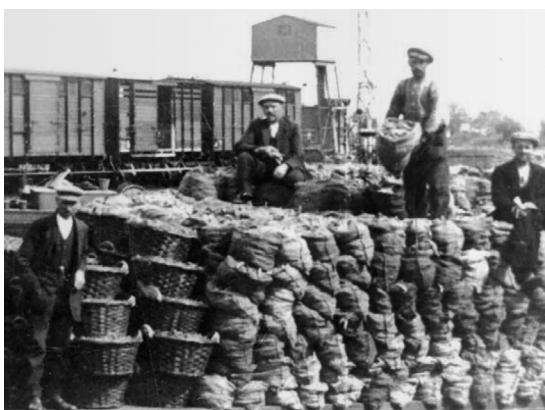
Wachten op transport.

Met deze alinea opent route 1 van de in 2020 verschenen 'Een grand tour door historisch landschap'. Hierin worden onder meer spoorlijnen en het omliggende landschap beschreven. Zo ook dat tussen Nieuwveen en Alphen aan den Rijn waar op 1 augustus 1915 een spoorlijn in gebruik werd genomen. Op 2 januari 1918 kwam er een verbinding tussen Nieuwveen en Ter Aar. De exploitatie kon echter niet uit met als gevolg dat in 1936 voor beide sporen het doek viel. Omdat het treintraject van Nieuwveen naar Alphen aan de Rijn door het gebied van de verlichte proeverijenroute Nieuwkoop-Alphen aan den Rijn gaat, vanouds voorzien van uitstekende vaarwegen, vermelden we het hier. De treinverbinding was een tijdlang van belang voor de tuinders in Papenveer en omgeving. Vanaf de veiling konden hun producten zo snel naar de afnemers in binnen- en buitenland vervoerd worden. Het groenteveilinggebouw in Papenveer lag direct tegenover het station. Het was de aanleiding voor de aanleg van een zijarm van het spoor, het zogeheten Groentelijntje.